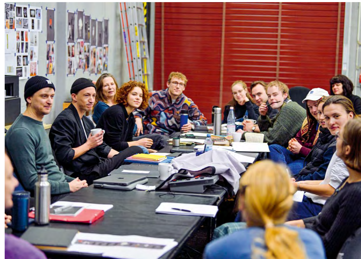
Inszenierungsteam und Ensemble bei der Konzeptionsprobe