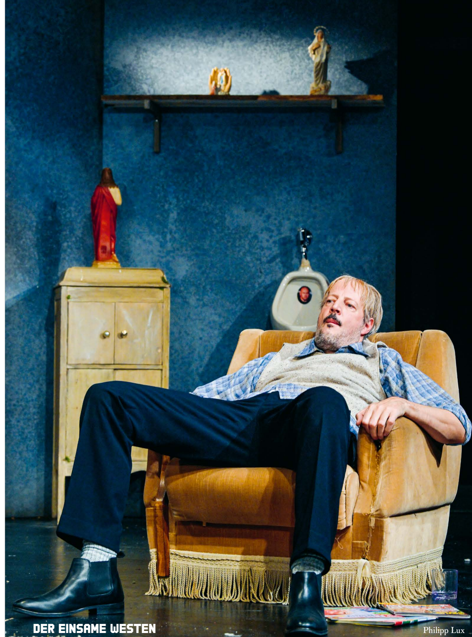
DER EINSAME WESTEN