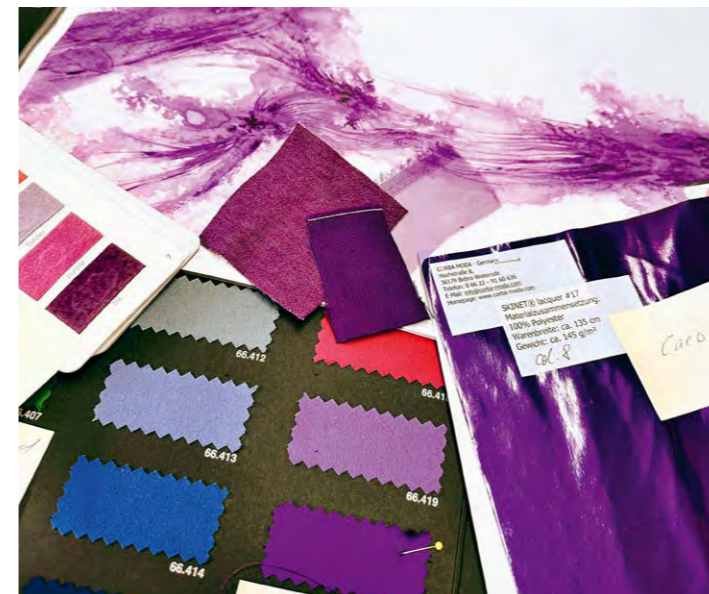
Zeichnungen und Stoffproben für die Entwicklung des Kostümbilds

weshalb sie auch für Opulenz, Macht und Extravaganz steht. Goethes Farbenlehre selbst beschreibt Violett in zwei Gruppen: „Rotblau: Es hat eine steigernde Wirkung und hat dadurch etwas Wirksames. Es macht unruhig. (...); Blaurot: Die Unruhe nimmt hier weiter zu, ein ganzer Raum in dieser Farbe muß [sic!] eine Art Unerträglichkeit von Gegenwart sein. (...)“. Davon sind Bedeutungen wie Glaube, Buße, Mystik in verschiedensten Erscheinungsformen, Unruhe, Gegenwartsflucht, Macht und Übermacht für FAUST relevant.