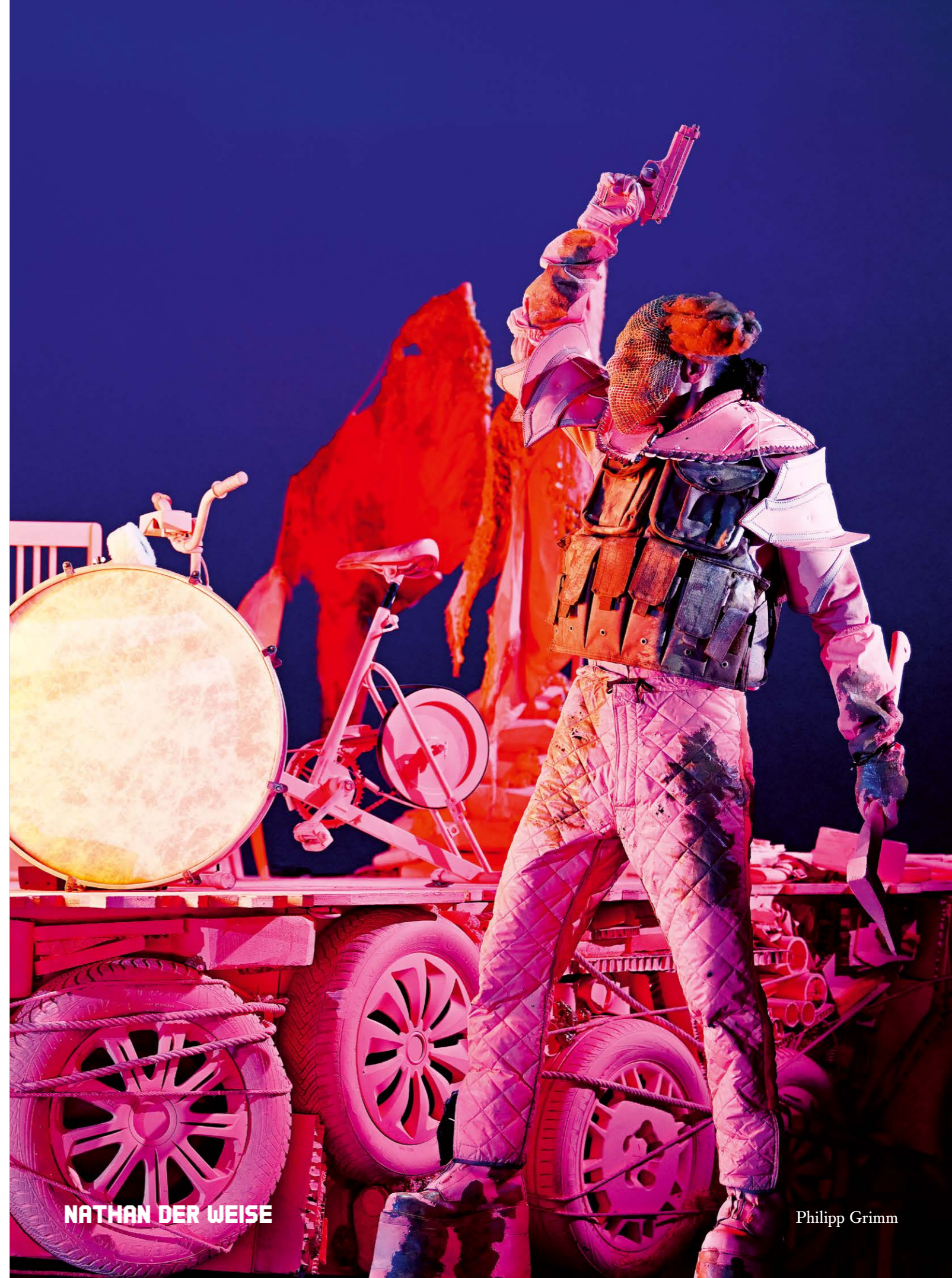
NATHAN DER WEISE